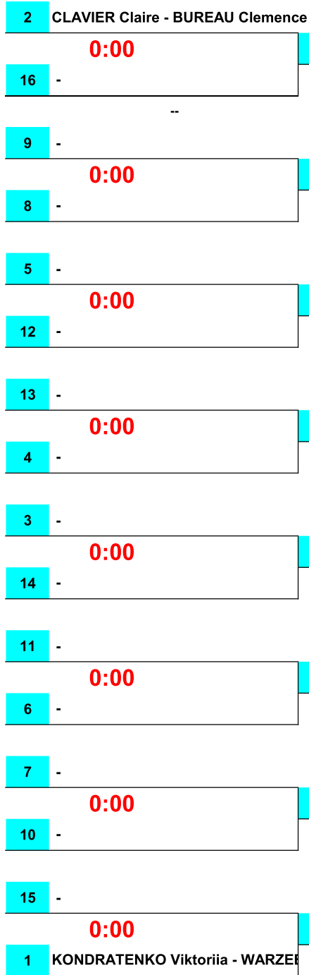
Tableau DOUBLES DAMES